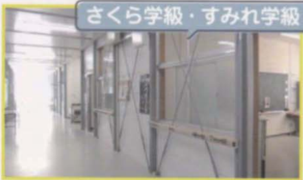
さくら学級・すみれ学級