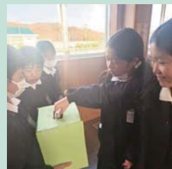
高須小学校での募金活動の様子